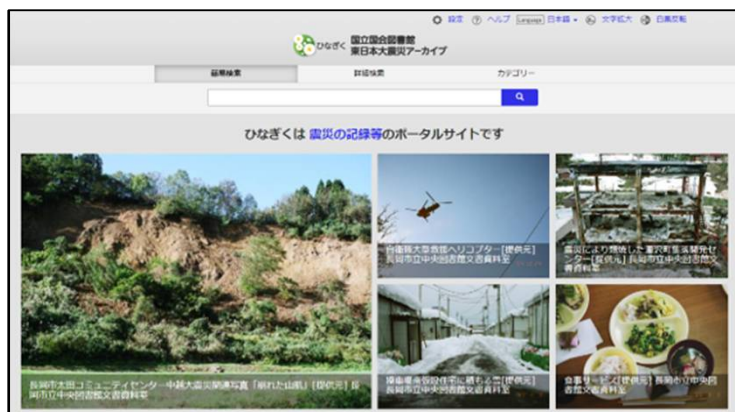
新潟県中越地震の特集