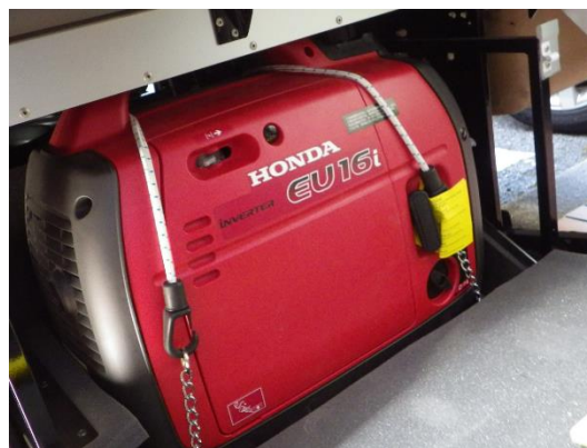
ポータブル発電機（1600W）