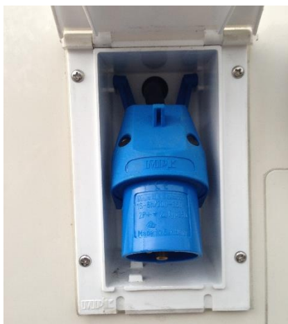
外部電源（100V）取込用コネクタ

そのほか、車体の天井部分には、ソーラーパネル（182W）が設置されており、晴天時であれば調剤機器を動かす程度の充電・蓄電は可能になっています。