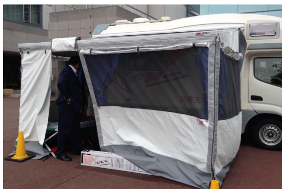
サイドオーニング（プライバシールーム展開）