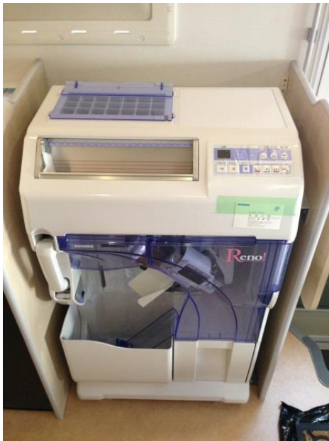
自動分割分包機 (ユヤマ Reno-S)