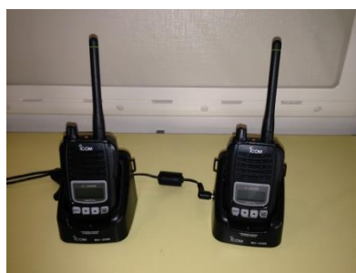
携帯型デジタル簡易無線機（アイコムIC-DPR6）