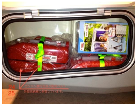
発電機用ガソリン携行缶（10ℓ×2）、安定ジャッキ