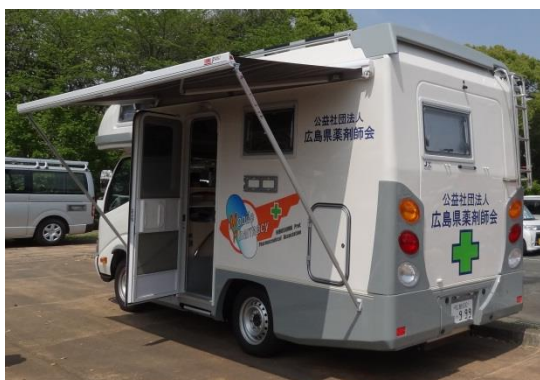
サイドオーニング（展開）