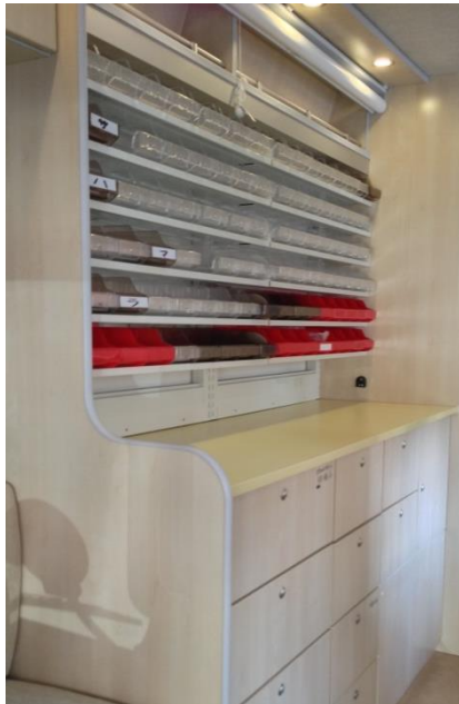
引出カウンター付 調剤棚