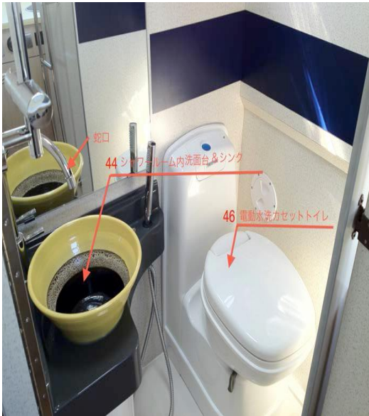
洗面台・カセット式水洗トイレ（温水シャワー室）