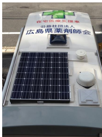
ソーラーパネル（182W）・BS/CS アンテナ等