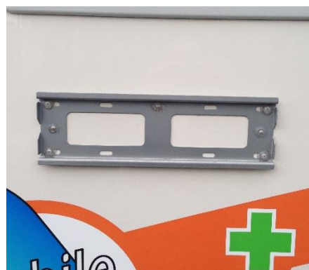
液晶テレビ（40インチ・車体側面に取付可）