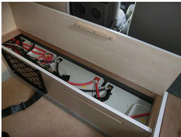
ディープサイクルバッテリー（100Ah×3台）