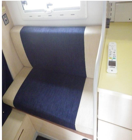
F Fヒーター（椅子の下部右側に吹き出し口あり）