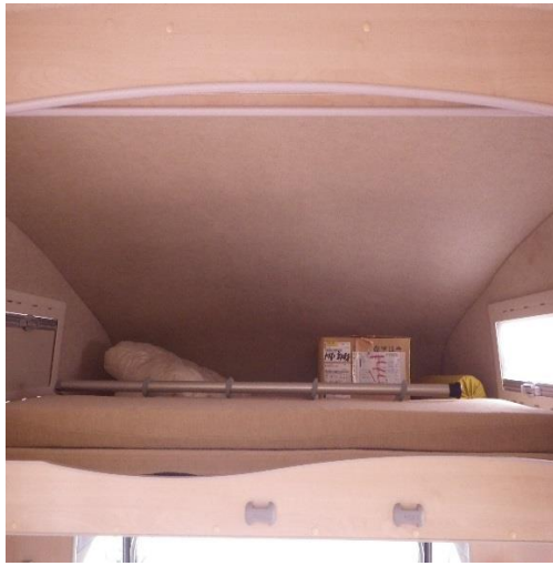
バンクベッド（3名就寝可）