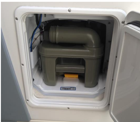
カセット部分（水洗トイレ）