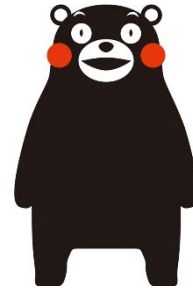
熊本県マスコットの「くまもん」

平成27年の「第3回国連防災世界会議」で採択された「仙台防災枠組 2015-2030」では、自助・共助の重要性が国際的な共通認識とされましたが、これを踏まえて、防災推進国民会議が発足しました。そして、平成28年より、内閣府政策統括官(防災担当)、防災推進国民会議及び防災推進協議会が、実行委員会を組織して、国民全体の防災意識の向上を目的に、ぼうさいこくたいを毎年開催しています。