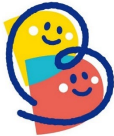
「ぼうさいこくたい」のロゴ「Bちゃん」