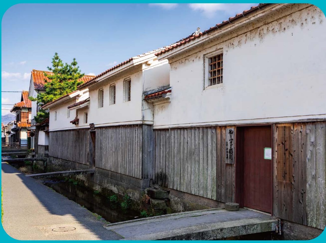
倉吉市打吹玉川伝統的建造物群保存地区